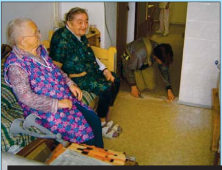
Obyvatelky domova sledují, jak řemeslníci dokončují opravu podlahy.

vebních akcí v sociálních zařízeních Vysočiny a jediná, která směřuje ke zlepšení bydlení. Kraj se doposud zaměřoval na havarijní opravy třeba střech či kuchyní,“ vysvětlila radní pro kulturu, zdravotnictví a sociální věci Martina Matějková (ODS).